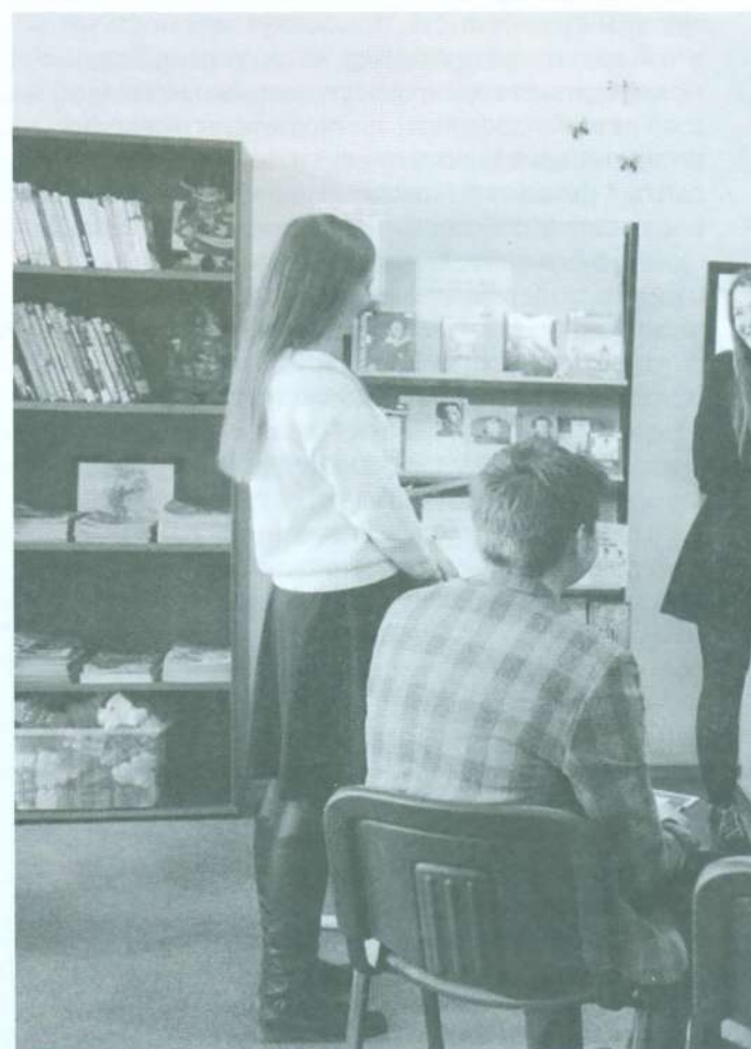
ШКОЛЬНАЯ БИБЛИОТЕКА: СЕГОДНЯ И ЗАВТРА. № 5. 2020