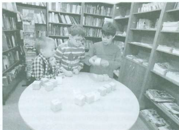
«IT-биатлон», спринт-игра по основам кибербезопасности

Не остались без внимания и юные пользователи. В этот же день, но чуть позже, для них состоялась спринт-игра на скорость «IT-биатлон».